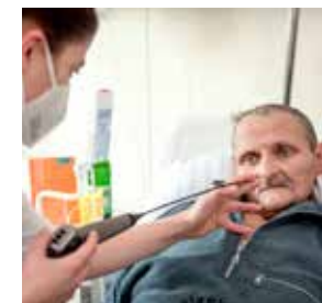
Schluckdiagnostik mit dem Endoskop

Diagnostik und Therapie von Sprech-, Sprach-, Stimm- und Schluckstörungen bei Kindern und Erwachsenen z.B. M. Parkinson, Aphasie nach Schlaganfall, Demenz, Hirnverletzungen, Laryngektomie Fazialisparese, funktionellen und organischen Stimmstörungen, frühkindliche Hirnschäden Sprachentwicklungsstörungen.