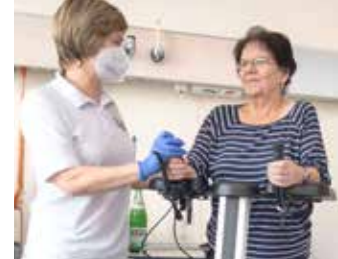
Physiotherapie zur Mobilisation und Frührehabilitation nach der Operation

Ein Großteil unserer ambulanten Leistungen finden im Ambulanten Therapiezentrum in Langenfelder Straße statt. Bitte beachten Sie dazu unseren gesonderten Flyer!