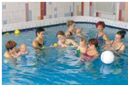
Babyschwimmen im Bewegungsbad

Das Zentrum für Physikalische und Rehabilitative Medizin beschäftigt sich nicht nur mit Erkrankungen des Bewegungssystems sondern auch mit internistischen, neurologischen, gynäkologischen u. a. Krankheitsbildern.