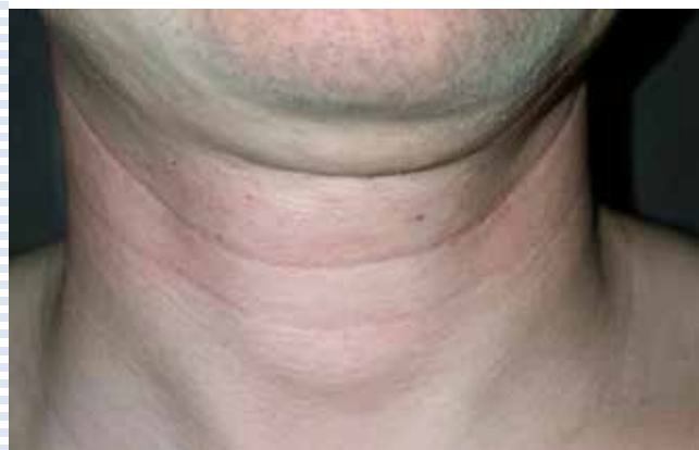
Beispiel für postoperative Narbenbildung